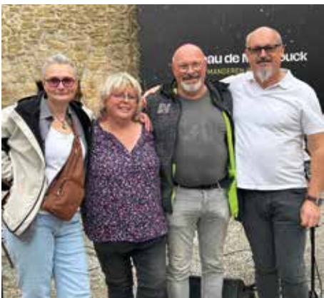
EMAVS au chateau de Manderen 12 juin