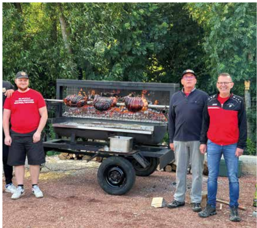
Eskm brocante et pétanque